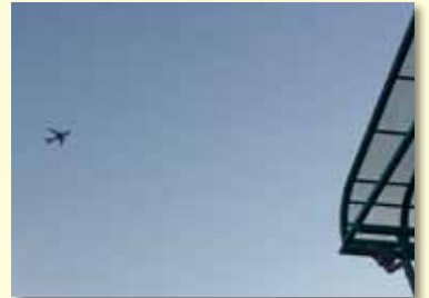
こんな感じ?川口市上空を飛行する航空機

(感想) 今後とも国土交通省、関係自治体等の動向を注視し、市民に対しては積極的な情報提供を行っていくことを要望しました。