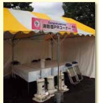
平成29年「はたちの集い」会場に設けられた消防団PRコーナー

(感想) 以前、私が提案した「消防団カレンダー」の作成等も視野に入れ、今後も積極的な団員確保策の展開を期待します。