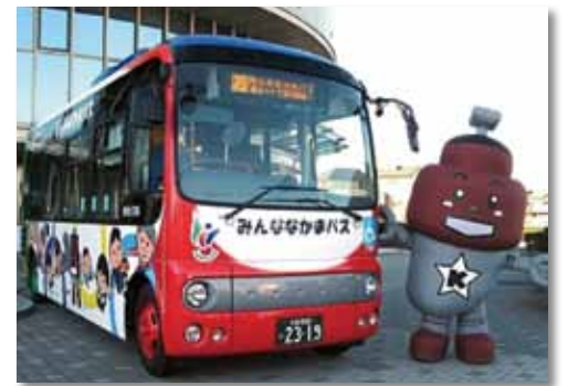
みんななかまバス

平成28年12月から、みんななかまバスの運行経路と時刻の一部が変更されました。対象路線は川口・鳩ヶ谷線、青木線、神根循環、戸塚・安行循環の4路線。なお、新郷循環にあつては、車両2台による社会実験実施路線として指定され、運行便数も1日当たり13便と倍増されています。