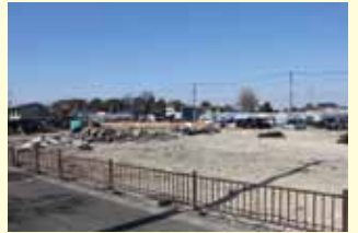
旧駅前広場撤去工事

【質問】 新井宿駅の交通広場の移転・整備については、駅周辺の住民の方々はもとより、同駅を利用する多くの乗降客にとって、大いに関心がある。新井宿駅交通広場整備事業の現状と今後のスケジュールにつき、同広場を利用するバス運行への影響を含めて説明を頂きたい。