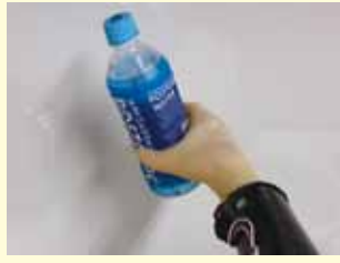
筋電義手は物を掴むことが可能

【質問】 筋肉収縮時の微量の筋電位を利用して、本人の意思で指を動かせる筋電義手。現在、小児用筋電義手については、訓練を受け習熟すれば、約150万円の費用に対して自己負担額37,200円までで、残りは公費負担で購入することが可能である。しかし、訓練用の筋電義手については公費負担の制度が無い。また、訓練に対応できる医療機関も限られることなどから、筋電義手自体があまり普及していないのが現状である。