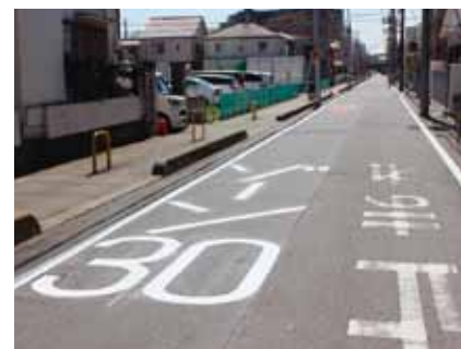
ゾーン30・南鳩ヶ谷7丁目

生活道路における面的な速度規制により、歩行者の安全を確保するため、区画線等路面標示を行う道路速度規制安全対策事業。「ゾーン30」と呼ばれるこの事業、鳩ヶ谷地区内では、平成29年度には南鳩ヶ谷7丁目で実施されており、引き続き30年度には南鳩ヶ谷6丁目及び同8丁目地域で実施される予定です。