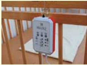
乳幼児用呼吸モニター

奥ノ木信夫市長 提言内容を早期に実現し、対策を講じるよう、関係部局に指示した。提言に対する実施状況では、「事故防止マニュアルの作成」については、「緊急連絡体制の整備」の提言も含め、日々の保育や事故防止の取り組み等を示した保育マニュアルを作成し、認可外保育施設への立入調査に合わせて順次配付し、周知している。「保育士・保育従事者研修の充実」では、今年度から新たに救命講習を追加している。「乳幼児用呼吸モニター」の設置支援については、全ての保育施設を対象とし、モニター購入費用を補助するための関連予算を今議会に上程した。今後とも、保育環境の更なる充実に努めて行く。