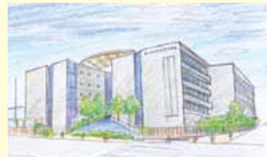
川口市立高等学校