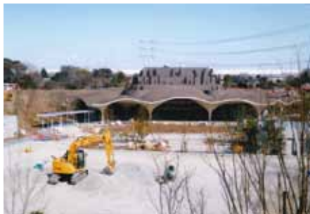
赤山歴史自然公園・イナパーク川口

赤山歴史自然公園・イナパーク川口が一部開園します。同公園の面積は8.9ヘクタール。展示室などを備えた「歴史自然資料館」の他、「地域物産館」、遊具などがオープン。同公園内の火葬施設「川口市めぐりの森」も運用開始します。同公園の全面開園は平成34年度の予定です。