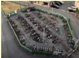
鳩ヶ谷駅第2自転車駐車場

【質問】 鳩ヶ谷駅西口駅前広場の北側に位置する鳩ヶ谷駅第2自転車駐車場は、旧鳩ヶ谷市時代に都市計画決定されたもので、計画では地下部分に680台を収容する自転車駐車場、地上部分は公園とすることとなっている。現在は暫定的に地上部分の東側に平置き自転車・バイクの駐車場、西側に小規模の公園が設置されている。近年、同駅西口周辺には大型マンションが相次いで完成し、公園設置の要望も数多く寄せられている。同自転車駐車場につき、計画通りの事業執行はできないのか。