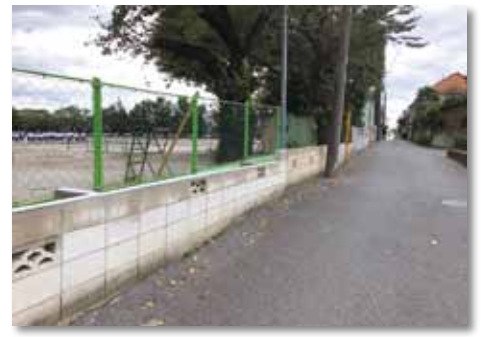
鳩ヶ谷中学校のブロック塀は危険部分の撤去を完了

一方、通学路に面した「危険ブロック塀」の所有者に対し、撤去及びフェンス等の設置工事費の一部を補助する「川口市既存ブロック塀等安全対策補助事業」関連補正予算が、12月議会において可決され、平成31年1月1日から実施されることになりました。